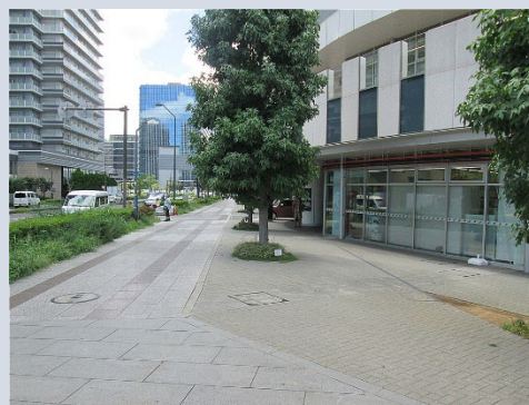
▲マンホールトイレ設置場所

マンホールトイレ設置の防災訓練を周辺マンションの防災担当者による協議会と共同して実施予定（令和5年度）