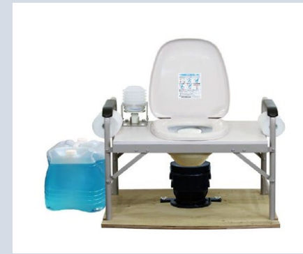
▲車いすマンホールトイレ