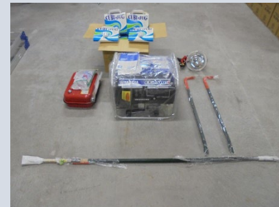
▲備蓄しているハロゲン投光器、バールなど